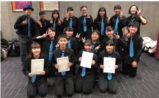
スーパーブルーバース（中学生高校生）

TEL & FAX 0465-82-9565 / honzawa@studiocranberry.com / http://www.kaisei-blue-birds.jp