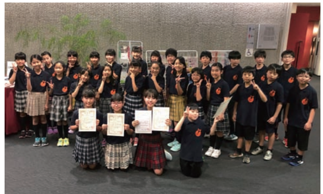
ブルーバース（小学生）