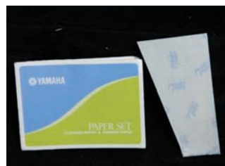
パウダーペーパー