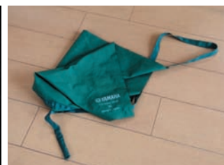
スワブを床に置くのはNG!