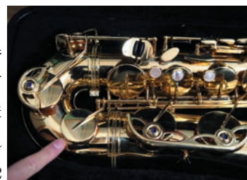
Low C#キー（テナーの場合）