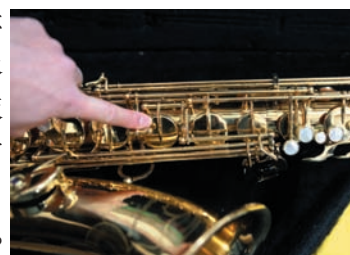
G#キー（テナーの場合）

また、スワブは大事な楽器の管内の水分を取り除いて清潔に保つ布ですから、床に置いたりぞうきん代わりにしてはいけません。（2014年2月号の記事を再掲）