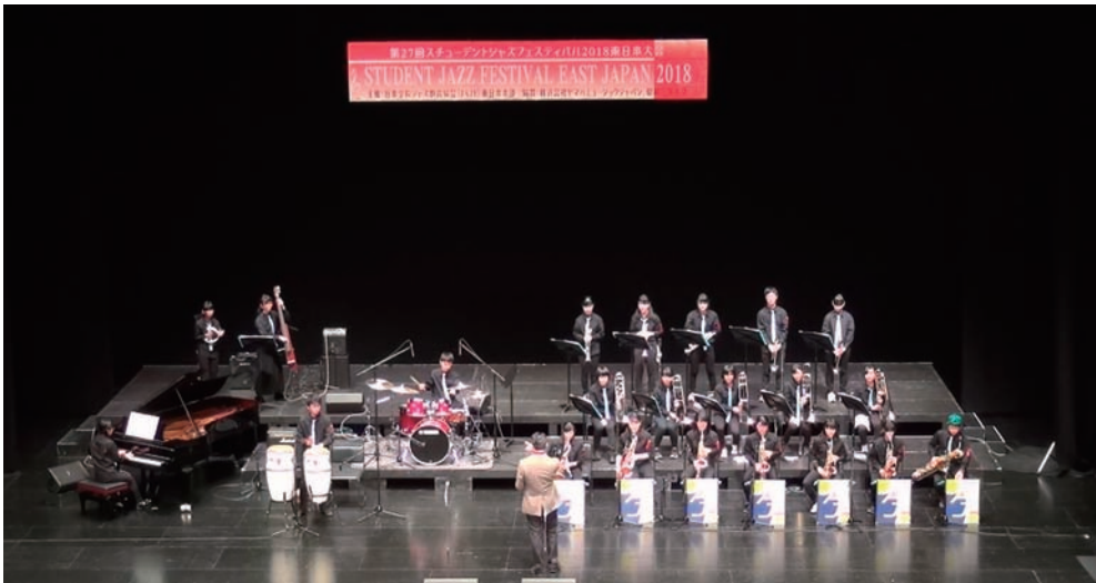
オリジナル曲を披露するスーパーブルーバース