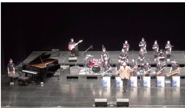
演奏を終えて拍手に応えるブルーバース

小学生バンド“ブルーバース”の16名については、惜しくも団体賞は逃しましたが、2名が優秀プレイヤー賞を獲得するなど、本格的なビッグバンド編成で出演する唯一の小学生バンドとして存在感を示すことができたようです。