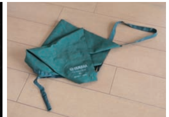
スワブを床に置くのはNG！