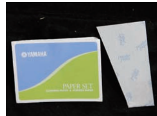
パウダーペーパー