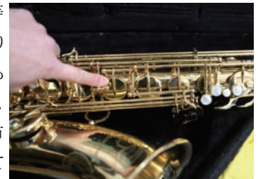
G#キー（テナーの場合）

また、スワブは大事な楽器の管内の水分を取り除いて清潔に保つ布ですから、床に置いたりぞうきん代わりにし