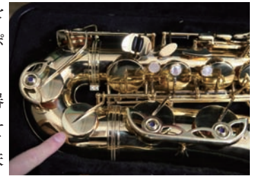
Low C#キー（テナーの場合）