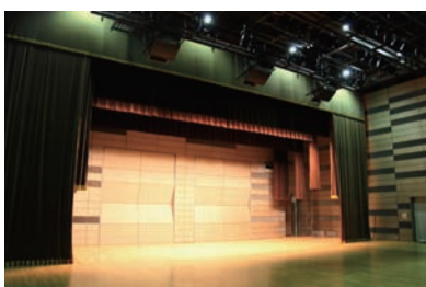
クリエイションホール

8月13日～14日、小学生バンドが1泊2日の夏合宿を行います。場所は、豊かな自然に囲まれた芸術体験施設・神奈川県立藤野芸術の家。