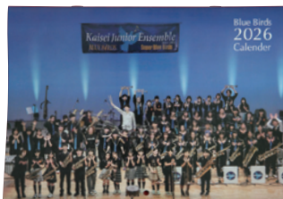
2026年カレンダー (割引あり)